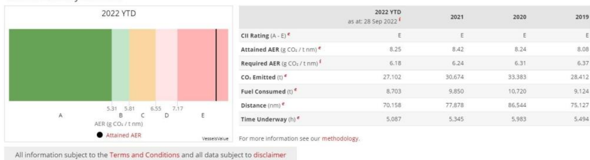
图 1.3: Lake Kivu (4902 车位, 厦门船舶重工 2006 年 11 月造, ) 及其 CII 等级

此外, 你永远不会后悔在一个不断上涨、炙手可热的市场上卖出船舶资产。以 Lake Kivu (4,902 车位, 厦门船舶重工 2006 年 11 月造) 为例, 其售价在 5,300 万至 5,600 万美元之间。这是一个让人乍舌的价格。自 2019 年 12 月以来, 该船价值增长了 195%, 回报率仍让人咋舌。